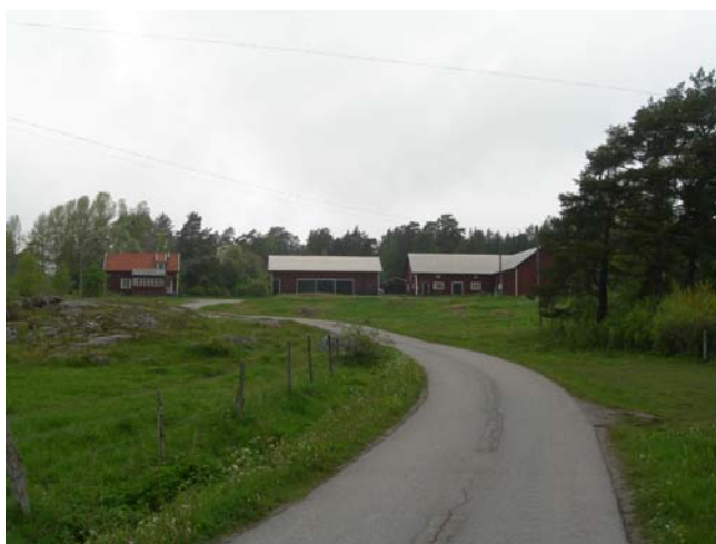
Brannebols gård med boningshus och ekonomibygnader, vy från öst.

Bostadshus och komplementbyggnader ska utföras med sadeltak, mansardtak eller pulpettak. Husfasader ska utföras med träpanel eller puts som huvudsakligt material. Solfångare får byggas i takfall.